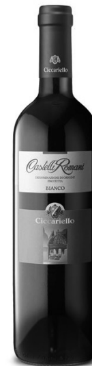
Castelli Romani Bianco DOP CAVICI

cole come si usa per affettare il salmone. Dopo di che