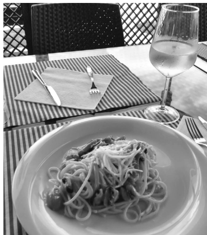
Spaghetti all'ischitana con cozze, peperoncini verdi e Provolone del Monaco

Ricetta per quattro persone: 500 gr di spaghetti di grano duro, 500 gr di cozze, 12 peperoncini verdi (detti friggittelli), 100 gr di pomodori datterini, prezzemolo, aglio e Provolone del Monaco.