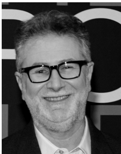
Il Giornalista e conduttore televisivo Fabio Fazio

F rits Bolkestein, vero nome di Frederik Bolkestein, è un economista e politico olandese. Prende il suo nome la direttiva Bolkestein, sulla libera circolazione dei servizi in seno all'Unione Europea. Oggi ultranovantenne probabilmente non proporrebbe la stessa direttiva. D'altronde in un'intervista ha dichiarato che non aveva pensato alla gestione degli stabilimenti balneari e delle aree demaniali marittime. Il suo obiettivo era quello di intervenire sulla libera circolazione dei servizi nell'ambito dei paesi dell'Unione Europea. L'Italia avrebbe dovuto esercitare il diritto di veto e fermare il progetto. E' stato sottovalutato, come spesso l, facendo alla fine scattare le sanzioni. Nei giorni scorsi manifestazione dei titolari degli stabilimenti balneari con apertura alle 9.30. Manifestazione promossa dal SIB. Assobal-