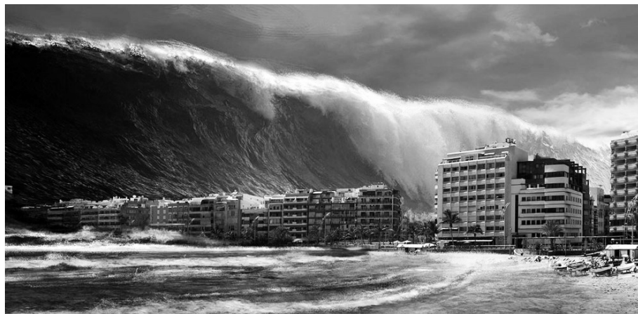
Immagine apocalittica da non sottovalutare

I venti catabatici che per la forza di gravità dalle alte catene montuose, spingono il freddo verso il basso e in qualche modo contengono il surriscaldamento globale causa dello scioglimento dei ghiacciai, causano a valle delle reazioni meteorologiche quali piogge, tifoni, trombe d'aria e alluvioni. Abbiamo visto come le alluvioni innalzano il livello delle acque. Nel 2100, gli idrogeologi, attraverso sperimentazioni simulate con programmi informatici mirati e utilizzando gli ultimi dati internazionali e nazionali sia sul surriscaldamento delle acque, dell'aria