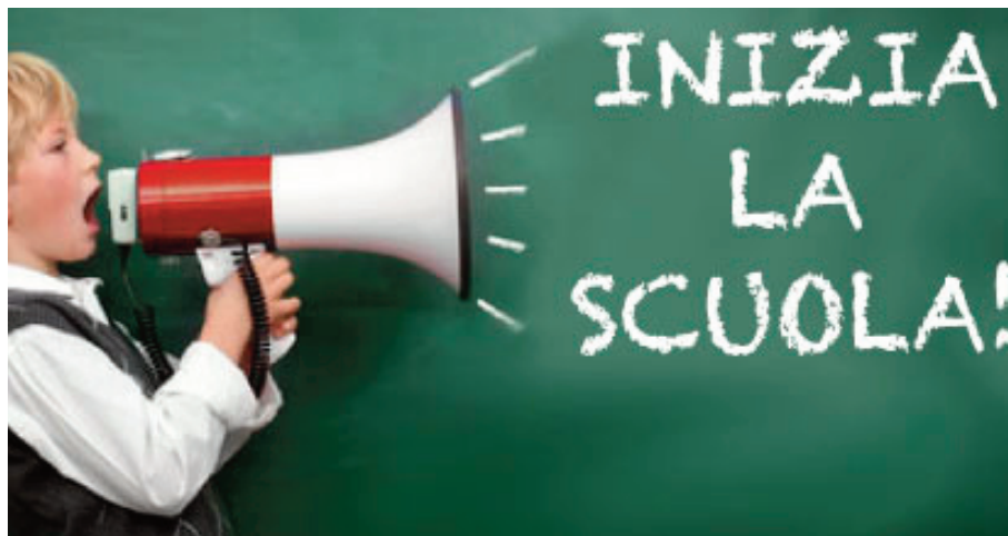
Le vacanze estive hanno i giorni contati