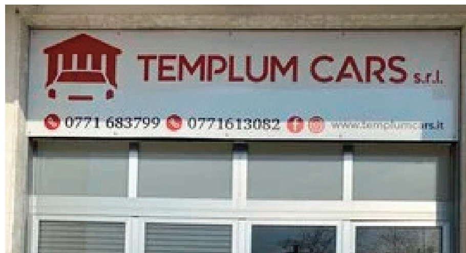
Una delle sedi dell'attività della famiglia Amendola