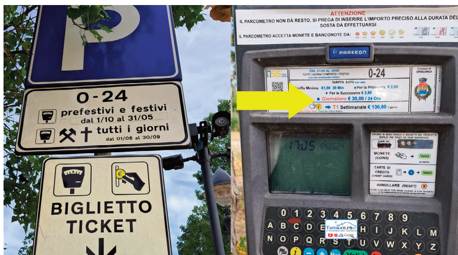
Una delle colonnine nella zona più costosa

Le reazioni a queste tariffe non si sono fatte attendere. I prezzi così elevati potrebbero infatti scoraggiare il turismo di prossimità, penalizzando chi vorrebbe trascorrere solo qualche ora in spiaggia senza dover affrontare un vero e proprio salasso. Dall'altra parte, i turisti, soprattutto quelli che si muovono in famiglia, vedono lievitare il costo di una giornata al mare, con un impatto significativo sul budget delle vacanze. C'è chi ha deciso di rinunciare a Sperlonga, optando per località limitrofe meno care, e chi invece ha iniziato a pianificare strategie