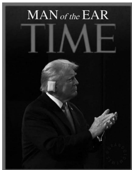
Due copertine di TIME

Perché se, in suo nome, dinanzi alle comunità evangeliche americane, il tycoon annuncia e promette la più grande deportazione di migranti della storia allora a quella divinità si dovrebbe rispondere solo con le parole dell'Allelujah di Leonard Cohen: dici che ho pronunciato il [ tuo ] nome invano / ma io neanche so il nome / e se anche fosse, a te cosa importa? In altre parole: mi sei così estraneo da non poterci neanche chiamare reciprocamente per nome. In altre parole: se ignori anche uno soltanto dei nomi di quei derelitti della terra quale divinità ti vantisti di essere? Il famoso incipit evangelico "In principio era..." è un po' come il "c'era una volta..." delle favole. Tutto dipende dalla parola scritta nei puntini sospensivi. L'evangelista Giovanni in quei puntini scrive: il logos (il Verbo) e certamente non pensava a un tiranno. Il suo, d'altronde, come sappiamo, è il vangelo più radicale, quello del comandamento nuovo, dell'amore, ma non la melassa del romanesco volemosse bene che poco ce costa ma del "se non ami il prossimo tuo come te stesso..." Quel logos, infine, rappresenta anche la Legge. Ed è proprio sul significato di questa parola che si gioca la scelta più radicale e l'equivoco più pernicioso dell'umanità. Il corpo della legge lavora con le sue due uniche braccia necessarie: il senso del limite nel dovere e la garanzia della libertà nei diritti. Ma almeno due visioni strabiche del mondo ne vogliono vedere soltanto