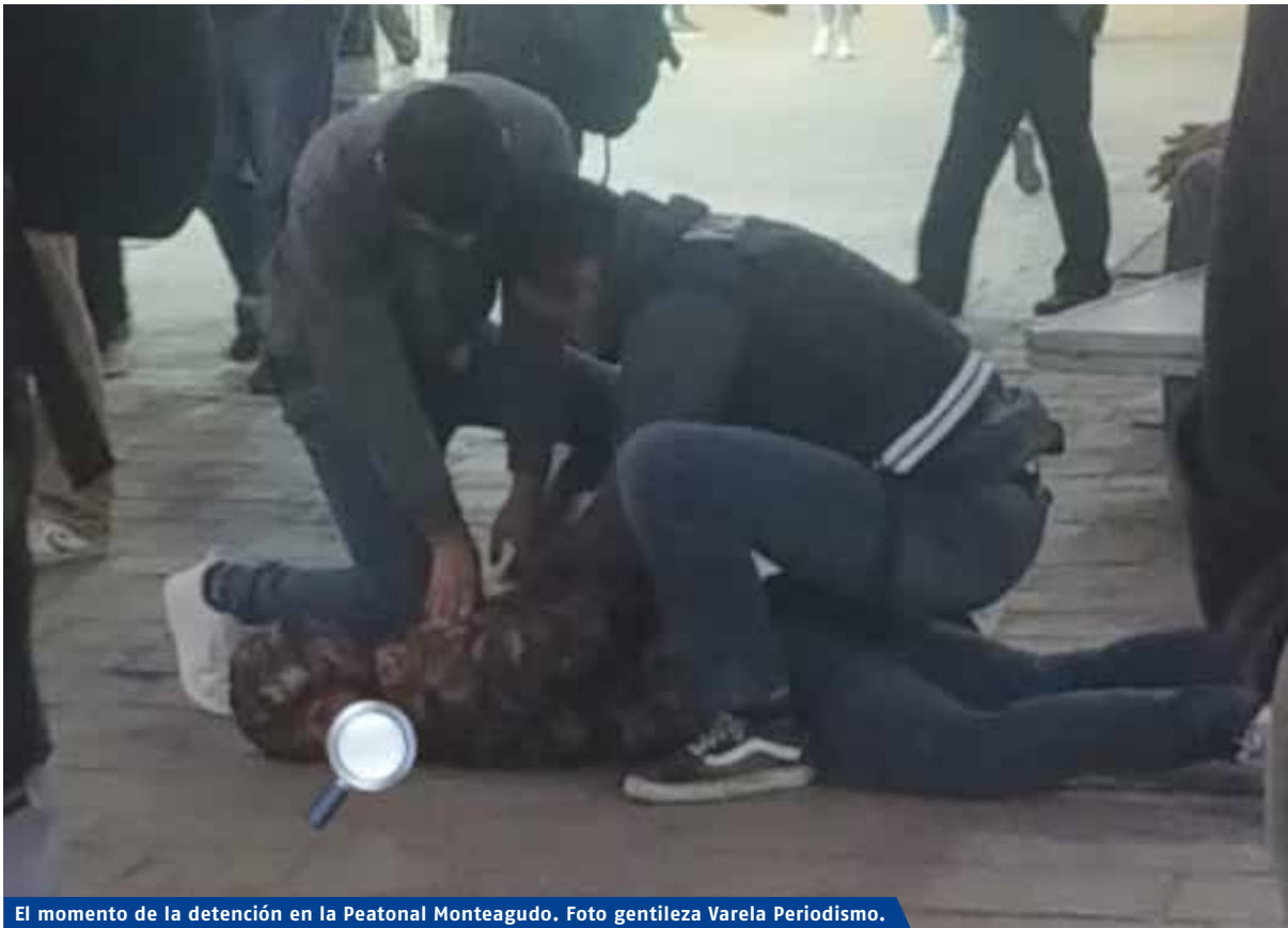
El momento de la detención en la Peatonal Monteagudo.

La Policía detuvo en Monteagudo y Presidente Perón a uno de los tres presos que escaparon tras romper los barrotes de una ventana. Un detenido sigue prófugo.